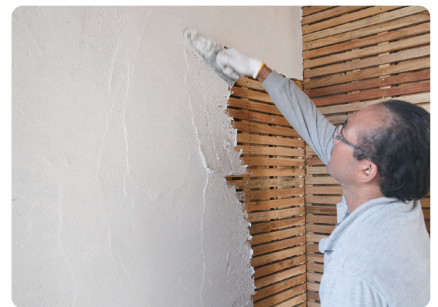
『瀬戸漆喰』木小舞への施工

～牡蠣殻抽出素材配合高強度漆喰～ プラスターボード不要。木と漆喰だけで壁がつくれ、これまで難しいと されていた大壁仕様にも使えます。 日本の住宅は美しい。古来から伝わる伝統の技術の難点を改善した、 シックハウスとは無縁の低コスト漆喰素材が生まれました。